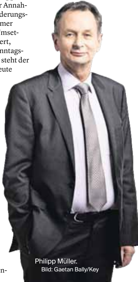
Philipp Müller.

Geht es in der Schweiz um das Thema Zuwanderung, führt kein Weg an Philipp Müller vorbei. Seit der Annahme der Masseneinwanderungsinitiative hat er sich immer wieder zu möglichen Umsetzungsvarianten geäussert, vorzugsweise in der Sonntagspresse. Im Mittelpunkt steht der FDP-Ständerat auch heute Mittwoch, wenn die Kleine Kammer über die Zuwanderungsfrage debattiert. Müller will die vom Nationalrat vorgeschlagene Stellenmeldepflicht ausbauen: In Berufsgruppen mit hoher Arbeitslosigkeit sollen Firmen inländische Stellensuchende zu einem Gespräch einladen und Nichtanstellungen begründen müssen. Das Modell orientiert sich an der Praxis des Kantons Genf und wurde im Bundeshaus von mehreren Parlamentariern herungereicht.